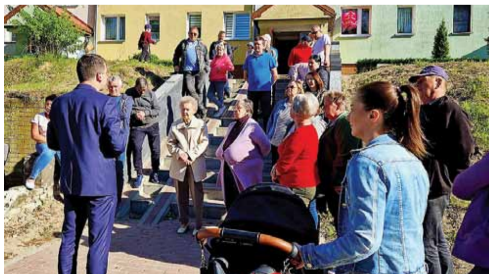
Spotkanie na ul. Przemysłowej