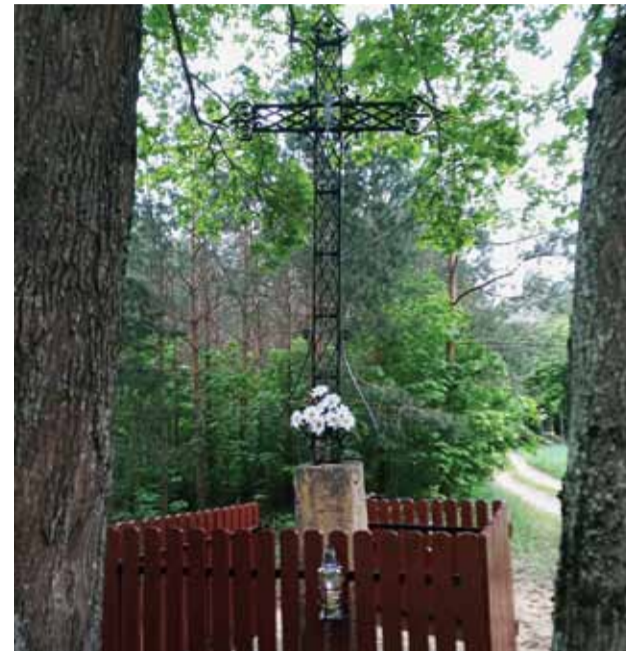
Krzyż po renowacji

Bez kapliczek przydrożnych i krzyży trudno sobie wyobrazić nasz krajobraz. Charakterystyczne obiekty warmińskiego - mazurskiego krajobrazu często są w opłakanym stanie. Przy dro-