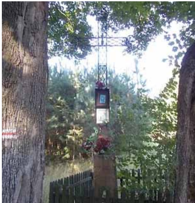
Krzyż przed renowacją

Zarówno Lidzbark jak i cała Gmina pełna jest kapliczek i miejsc pamięci, o których nie każdy z nas pamięta. W tej serii pragniemy przybliżyć Wam te miejsca. Być może niektóre z nich znacie i odkryjecie na nowo, a niektóre będą dla Was czymś nowym. Zachęcamy do odwiedzenia tych miejsc. Dbajmy o naszą wspólną historię.