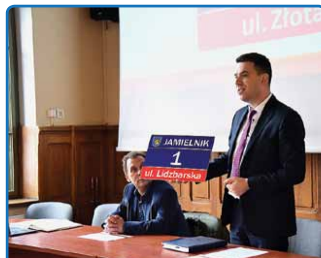
KOLEJNE SPOTKANIE Z MIESZKAŃCAMI JAMIELNIKA