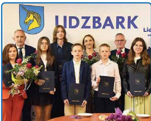
MAMY LAUREATÓW I FINALISTÓW