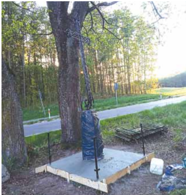
Krzyż w trakcie renowacji