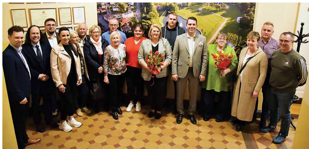
Rada Osiedla nr 4