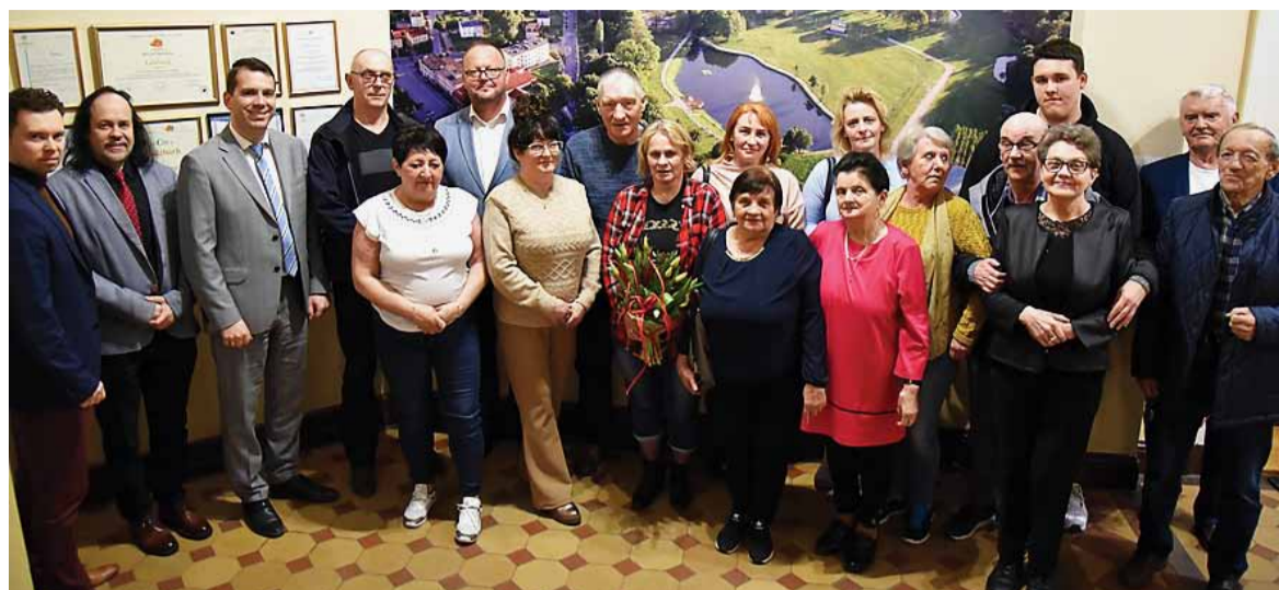
Rada Osiedla Centrum

W skład Rad Osiedlowych wchodzi 33 kobiety i 27 mężczyzn.