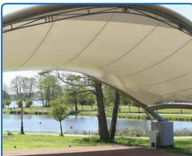
OTWARCIE AMFITEATRU JUŻ 26 MAJA