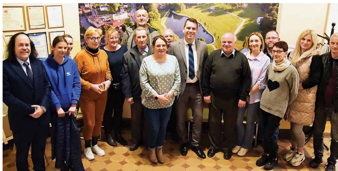
Rada Osiedla Skarpa