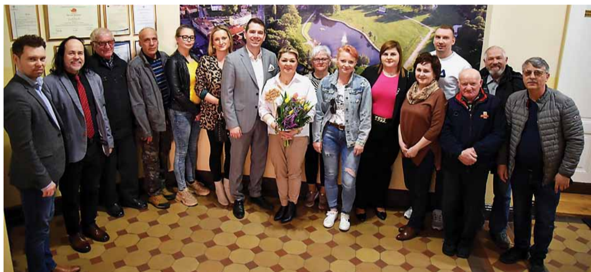
Rada Osiedla Działki