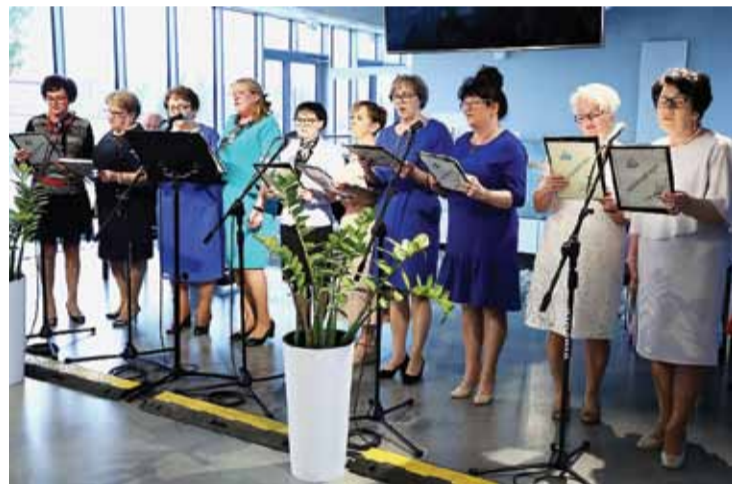
Fot: Krystyna Braun (3)